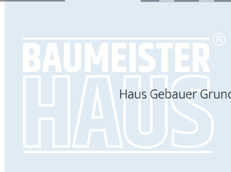
Haus Gebauer Grundriss OG