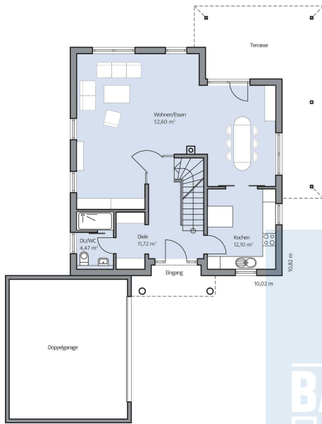
Haus Quirin Grundriss